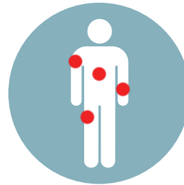
Dolor musculares y de espalda